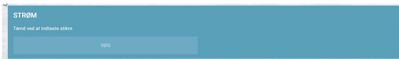
Figur 24 Søg strømstik på din konto online

Dette anvendes når/hvis du flytter rundt i havnen for service eller vinterplads mv.