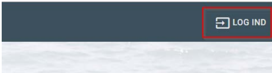
Figur 6 Vælg Log Ind

Indtast din e-mail adresse samt dit personlige password. Og vælg LOG IND