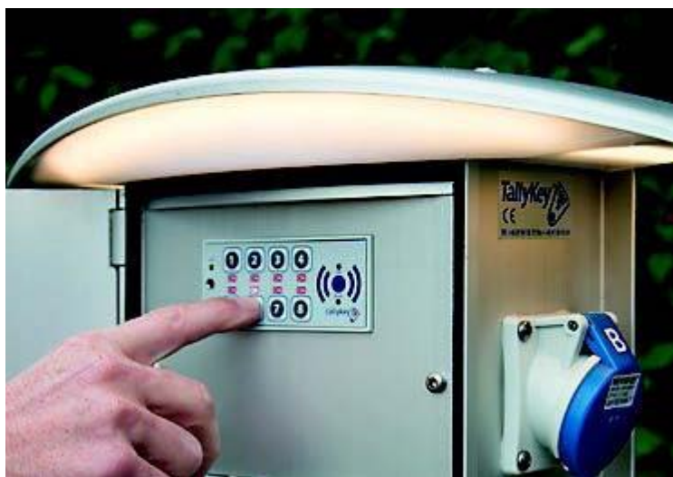
Figur 23 Keypad for strøm

Herefter skulle der være åben for strømmen.